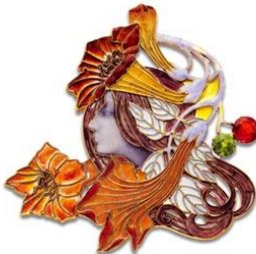
Pregador de René Lalique Peça em ouro esmaltado com uma esmeralda e um rubi, ambos com 3 quilates.

O Arte Nova: um estilo do virar do século