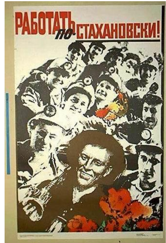
“Trabalhar como Stakhanov”