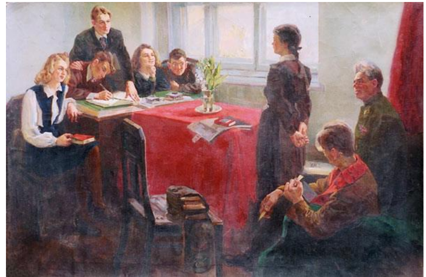
Exame de admissão ao Komsomol