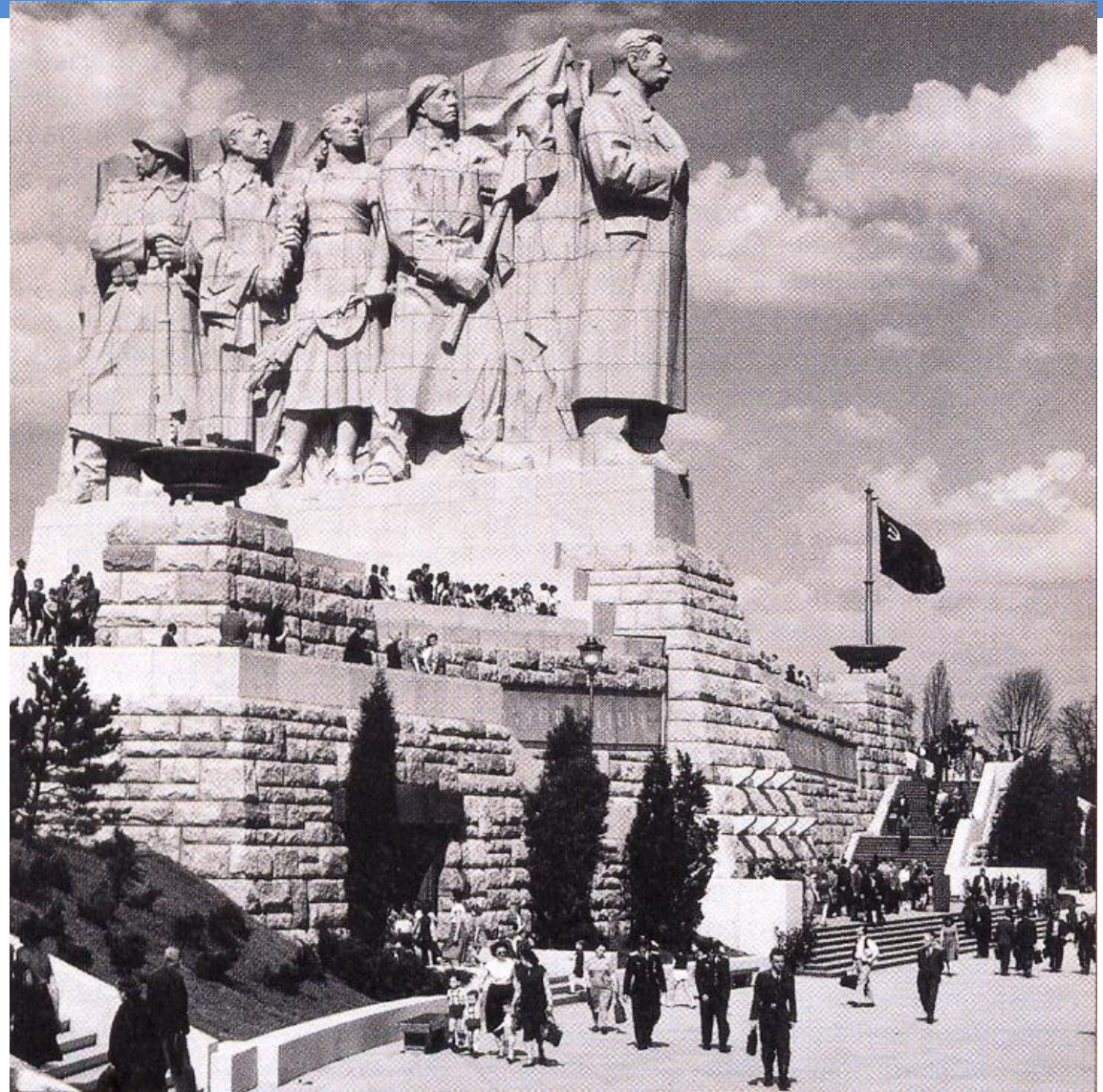
Praga, Museu do Comunismo