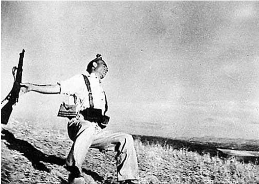
Espanha (1936): Morte de um combatente republicano