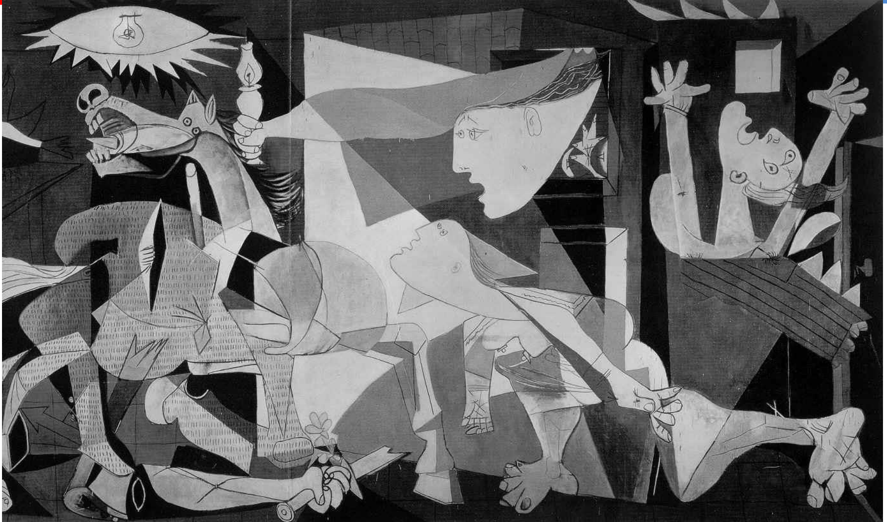
Guernica , de Pablo Picasso

Em memória da cidade basca bombardeada pela aviação alemã durante a guerra civil.