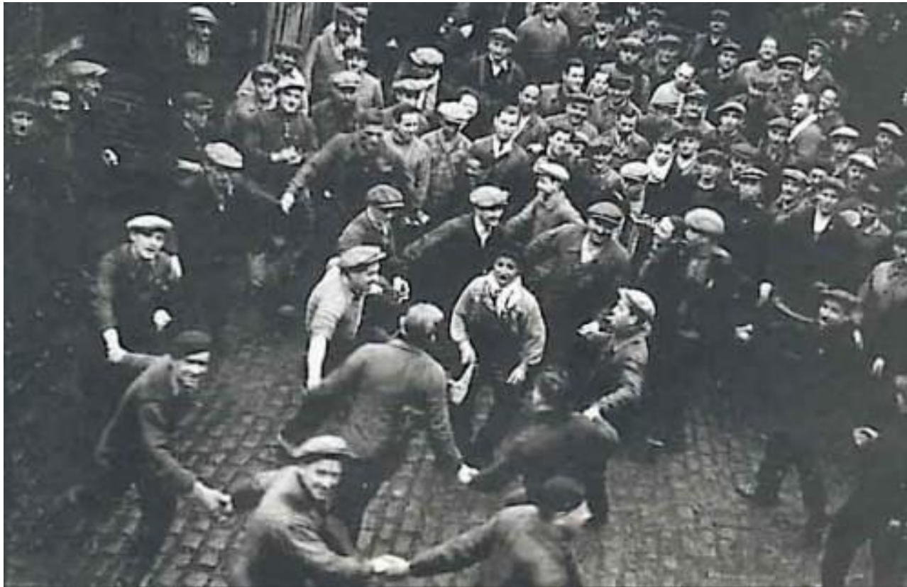
Comemorações populares pela vitória da Frente Popular francesa (1936)