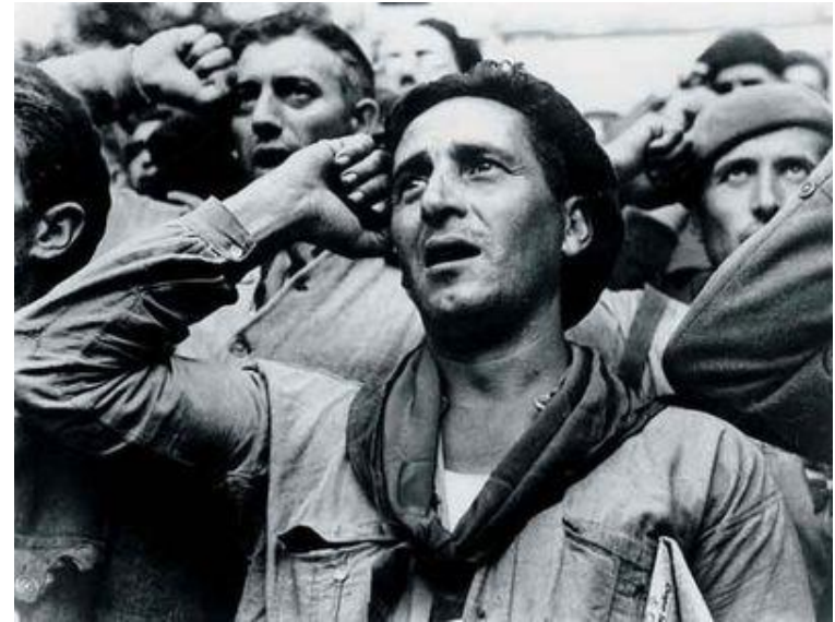
Espanha (out.1938): desativação das Brigadas Internacionais pelo governo republicano