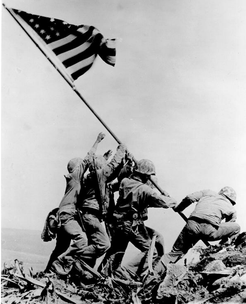
Fevereiro de 1945. Joe Rosenthal, Levantando a bandeira em Iwo Jima