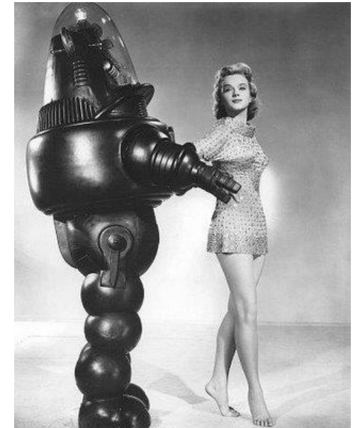
Visão do cinema: O Planeta Proibido (1956)