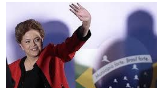
Dilma Rousseff (2011)