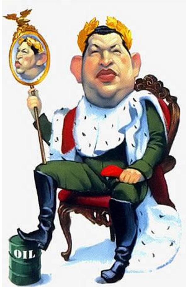
Hugo Chávez Venezuela