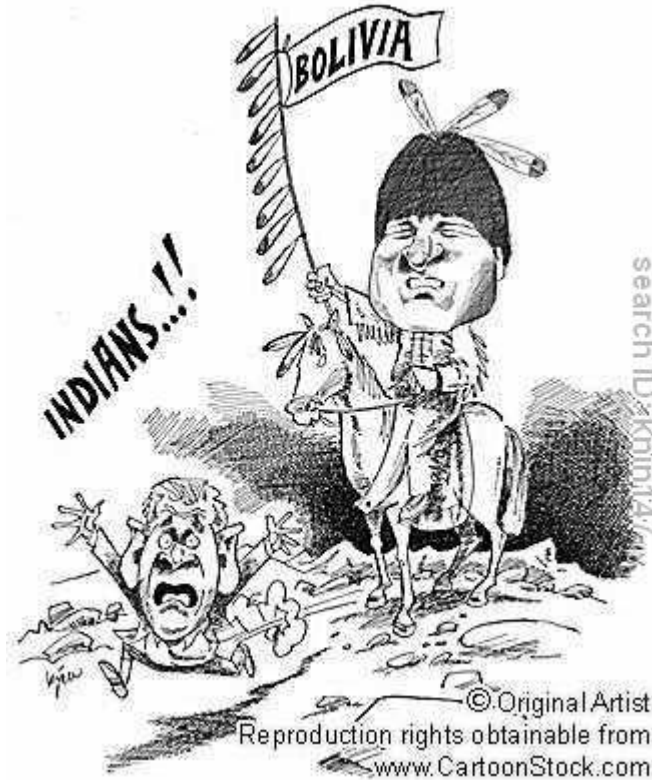
Evo Morales Bolívia