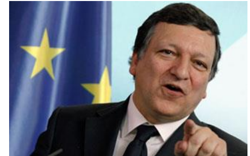
Durão Barroso Primeiro-Ministro (2002-04) Presidente da Comissão Europeia