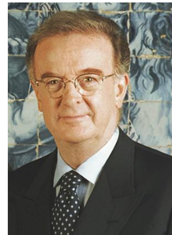
Jorge Sampaio Presidente da República (1996-2006)