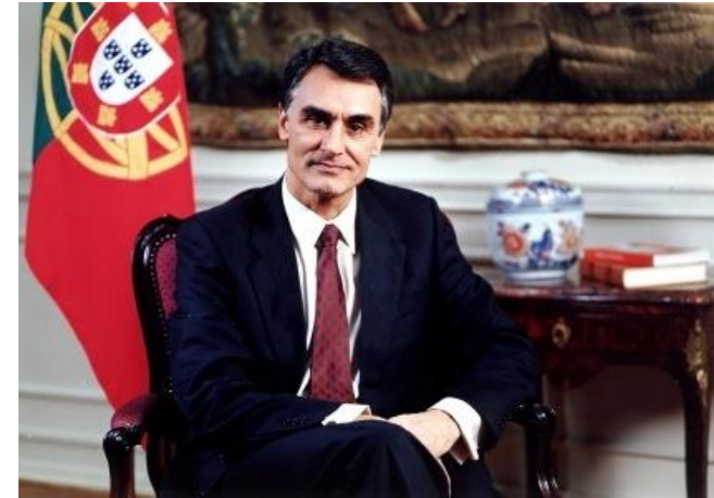
Aníbal Cavaco Silva Primeiro-ministro (1985-1995)