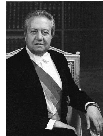
Mário Soares Presidente (1986-1996)