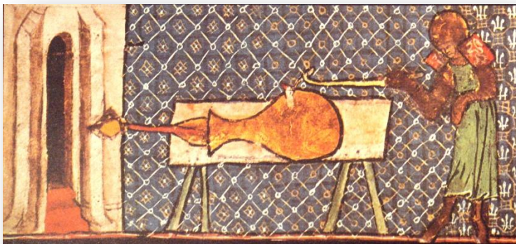
Mais antiga representação ocidental de um canhão (c. 1327)