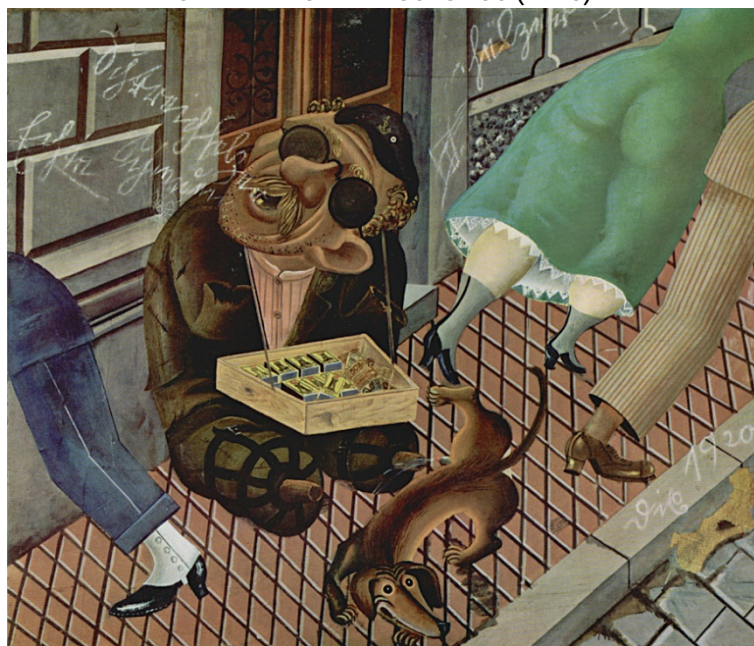
Otto Dix, O vendedor de fósforos (1920), Kunstmuseum, Stuttgart (Alemanha).