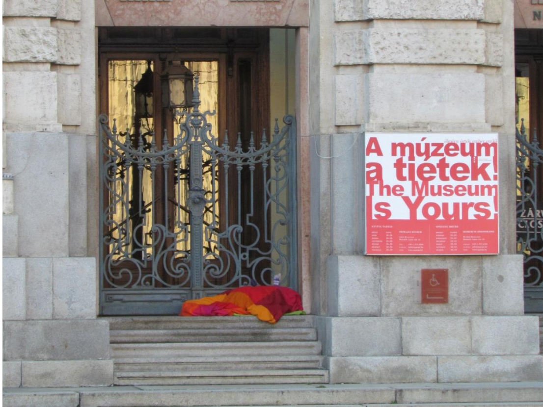
Néprajzi Múzeum Könyvtára (Museu Etnográfico), Budapeste, Hungria. Outubro de 2017

19. Comenta a imagem do Documento 4, relacionando-a com os seguintes tópicos: