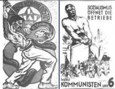
2. Cartazes do Partido Comunista alemão. À esquerda: Vota comunista, 1.maio.1924. Legenda na serpente: 10 horas por dia, assassinos dos operários, servos do Capital, exploradores! À direita: O Socialismo abre as fábricas. Vota nos Comunistas.