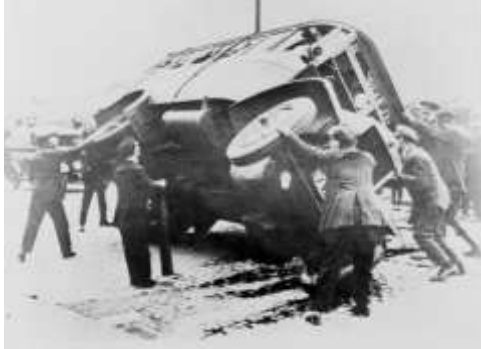
1. Homens tentando endireitar um autocarro derrubado durante a greve geral de 1926. Glasgow, Escócia