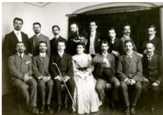
4. Fotografia da Gala do Curso Médico-cirúrgico 1899-1902. Ao centro, Carolina Beatriz Ângelo

8. O movimento feminista, organizado desde o século XIX, vai-se desenvolver principalmente após a I Guerra Mundial. Associa a cada uma das fotografias do Documento 9 uma (ou mais de uma) das características desse movimento.