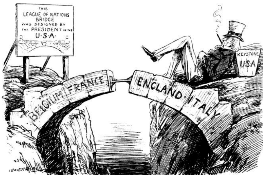
THE GAP IN THE BRIDGE.