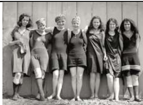
2. Fatos de banho para flappers em 1920