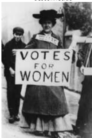
3. Membro da Women's Social and Political Union (WSPU), fundada por Emmeline Pankhurst, exhibe um cartaz: "Votos para as mulheres"