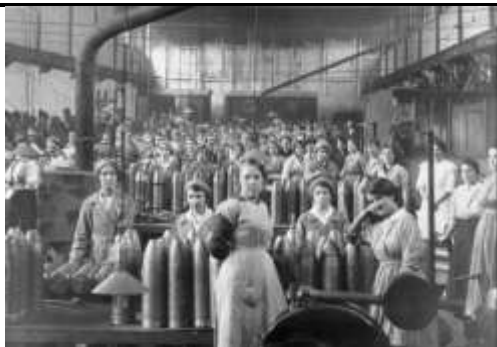
1. Jovens trabalhadoras enchendo bombas durante a guerra numa fábrica de localização desconhecida