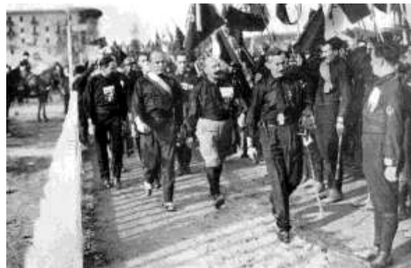
4. Marcha sobre Roma do Partido Fascista de Benito Mussolini