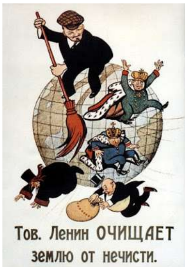
3. O Camarada Lenine limpa o mundo do lixo capitalista