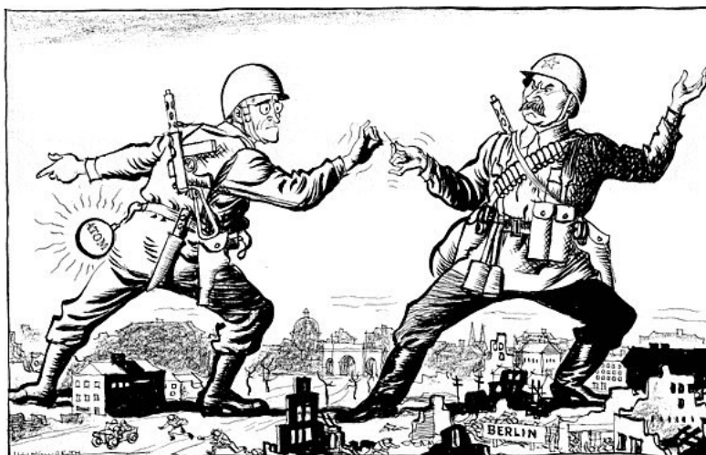
À esquerda, o Presidente Harry Truman (EUA); à direita, José Estaline (URSS)

13. Indica o contexto histórico que deu origem à caricatura do Documento 5.