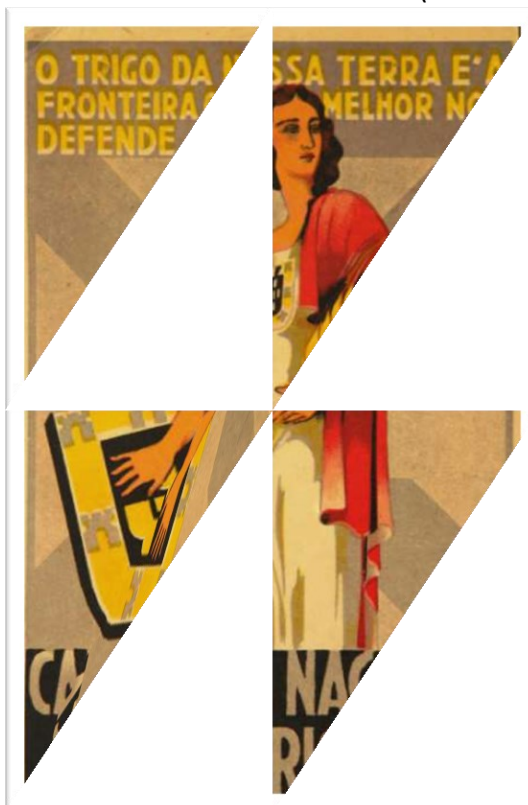
Cartão postal tipográfico: Campanha Nacional do Trigo - Portugal