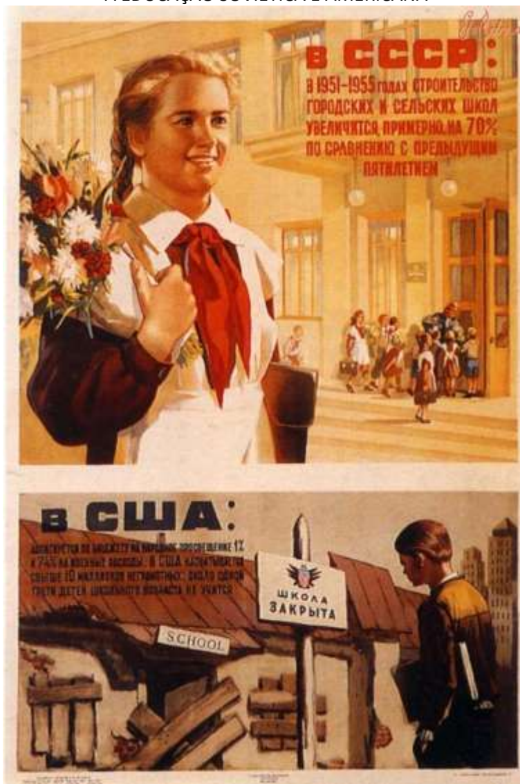
Em cima: URSS. Em baixo: EUA