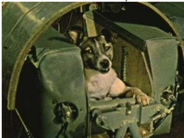
A cadela Laika fotografada no interior do simulador da cápsula Sputnik 2 (1957)