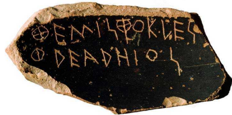
Ostrakon de finais do séc. V a.C com o nome de Themistocles Phrearrhios

Aristóteles, A Constituição dos Atenienses, c. 350 a. C.