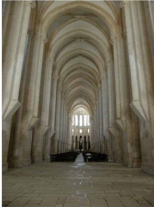
Documento 2 – Igreja do Mosteiro de Alcobaça, Portugal