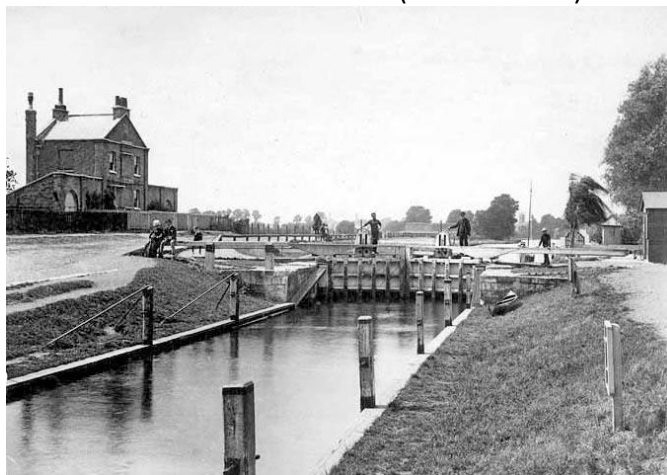
CANAL NO RIO TAMISA (foto de 1888)