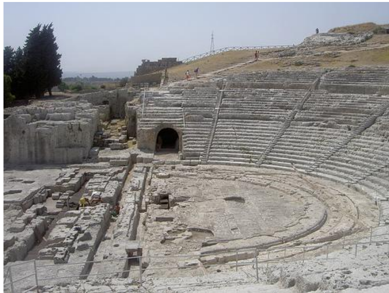
Teatro de Dionísio na acrópole de Atenas