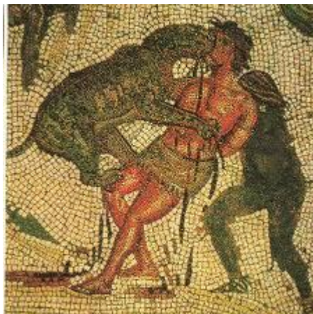
Mosaico romano (séc I)